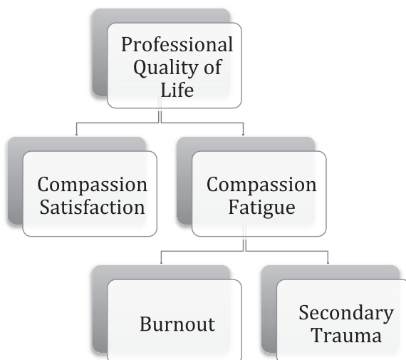
Figure 2 Professional Quality of Life Model (Stamm, 2013)

VT is described as something that is related to STS in that both are about being exposed to the trauma material of others, the difference being that VT is provoked by repeated exposure over time. Contrary to Figley, she now sees CF as a descriptive term addressing the quality of a person's experience. Pathology may also be present, but it would be comorbid to CF. Examples such as burnout accompanied by depression or CF accompanied with PTSD are offered.